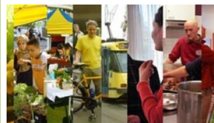
QUARTIERS DURABLES CITOYENS

www.environnement.brussels/thematiques/ville-durable/mon-quartier/operation-quartiers-verts